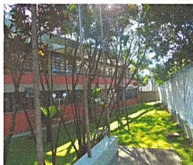
Figura 7 – Prédio Próprio da Av. Dos Estudantes, nº 3278, Jardim Aeroporto, em 2015.

Figuras 5 e 6 - Inauguração do Prédio Próprio em seis de agosto de 1977. Construído em terreno de 10800m 2 , com área ocupada de 4848m 2 , e área livre de 5952m 2 .