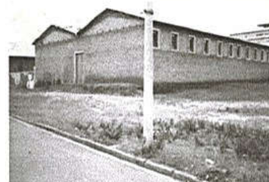
Figura 2 – Prédio da Av. Brigadeiro Faria Lima, Nº 5541, Vila São José, período de 1971 a 1977.