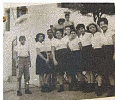
Figura 1 – Portão de entrada do Prédio Escolar da Rua Antônio de Godoy, nº 3564, Centro, período de 1956 a 1971.

Em 06/08/1977, o Centro Estadual Interescolar "Philadelpho Gouvêa Netto" é presenteado com a inauguração do prédio próprio situado na Avenida Dos Estudantes, nº 3278, Jardim Aeroporto (figuras 3 a 6). No decorrer dos anos, recebeu as denominações: Escola Estadual de Segundo Grau "Philadelpho Gouvêa Netto" (15/08/80); Escola Técnica Estadual de Segundo Grau "Philadelpho Gouvêa Netto" (10/06/85); ETE - Escola Técnica Estadual "Philadelpho Gouvêa Netto" (01/01/94, pelo Decreto 37.735/93 - CEETEPS); Etec - Escola Técnica Estadual Philadelpho Gouvêa Netto a partir de 2007 (figura 7).